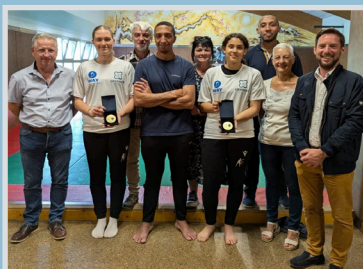
Les championnes de France

Pour marquer la fin de la saison et célébrer les 10 ans du Largentière Boxing Club, une cérémonie émouvante s'est déroulée au dojo de Largentière.