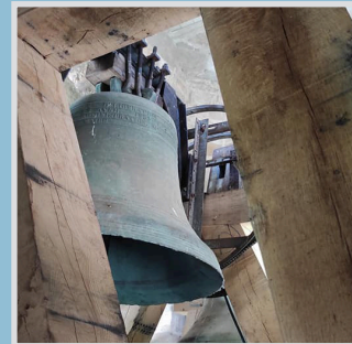
Nouveau beffroi en chêne

Le nouveau beffroi en chêne a été monté à la place de l'ancien et nous pouvons enfin entendre nos cloches chanter à la volée.