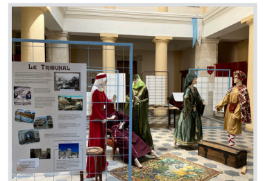
Exposition à l'ancien tribunal