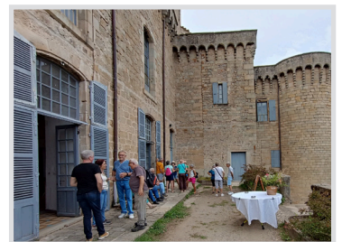
Évènement culturel au château

Ensemble, ils font vivre l'histoire et le patrimoine de la ville.